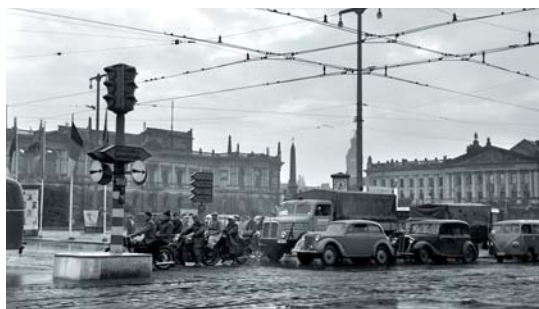
Der Augustusplatz zwischen Erhaltenem und florierender Motorisierung.

Der Kalender (Hochformat 40 x 50 cm) ist ab Oktober für 19 Euro im Buchhandel und in der Leipzig-Information erhältlich.