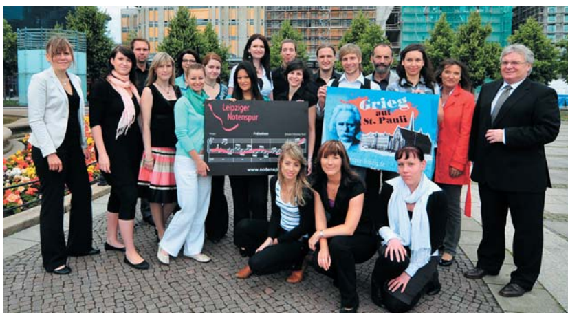
Die Projektgruppen der Uni Leipzig mit Vertretern der „Leipziger Freiheit“, von Ströer und der Notenspur-Initiative.

Marketing nach Noten: Die „Leipziger Notenspur-Initiative“ wird von der „Leipziger Freiheit“ und ihren Partnern in der Werbung unterstützt.