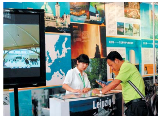
Die „Leipziger Freiheit“ übernahm die Standgestaltung zur „Biesepe“.

Zehn Tage später unterstützte das Stadtmarketing die Leipziger Messe International bei einem Auftritt auf der Umweltmesse „Biesepe“. Neben Flyern schickte die „Leipziger Freiheit“ auch Imagebroschüren in chinesischer Sprache nach Peking. Zur Messe „Heritage Preservation China“ vom 29. bis 31. Oktober reist die Leipziger Delegation mit einem ebenso umfangreichen Werbepaket an.