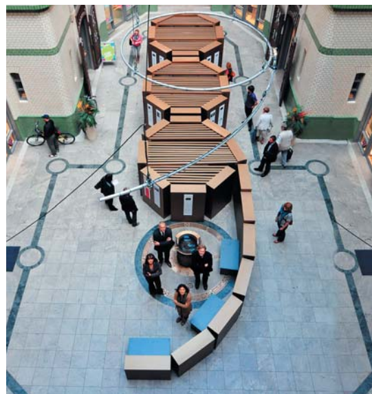
Die „89“ als informative Kunst.

Neben der FAIRNET GmbH als Hauptsponsor unterstützten die Jones Lang LaSalle GmbH (Centermanagement HansaHaus) und die Hess AG, ein